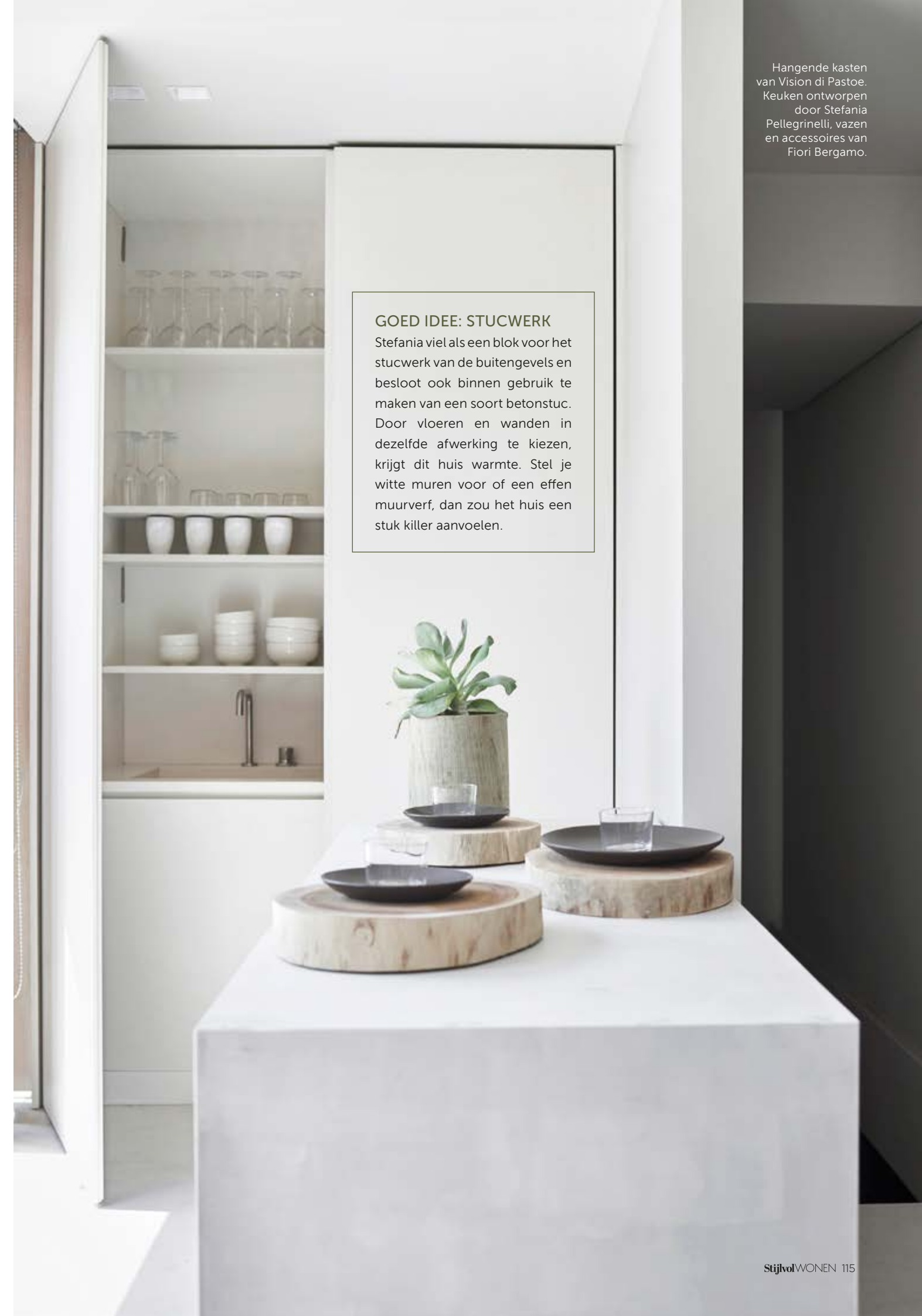
Houten trays van Fiori Bergamo.

“HET GAAT OM DE JUISTE WISSELWERKING: EEN KRACHTIG ONTWERP MET ZACHTE KLEUREN BIJVOORBEELD”