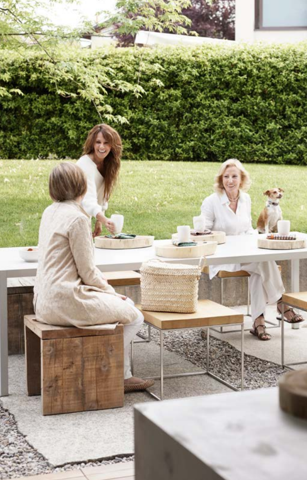
Tafel Keramik van MDF Italia, krukjes van Xam, houten trays van Fiori Bergamo. In de badkamer komen de kranen uit de Minimal Collection van Boffi. Al het linnen is van Society Limonta.